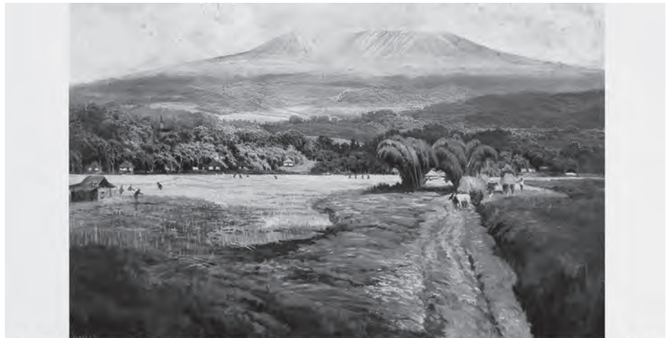
幻灯片 2 阿卜杜拉·苏鲁布鲁托 (Abdullah Suriosubroto) 创作的典型的《美丽的东印度》风景画