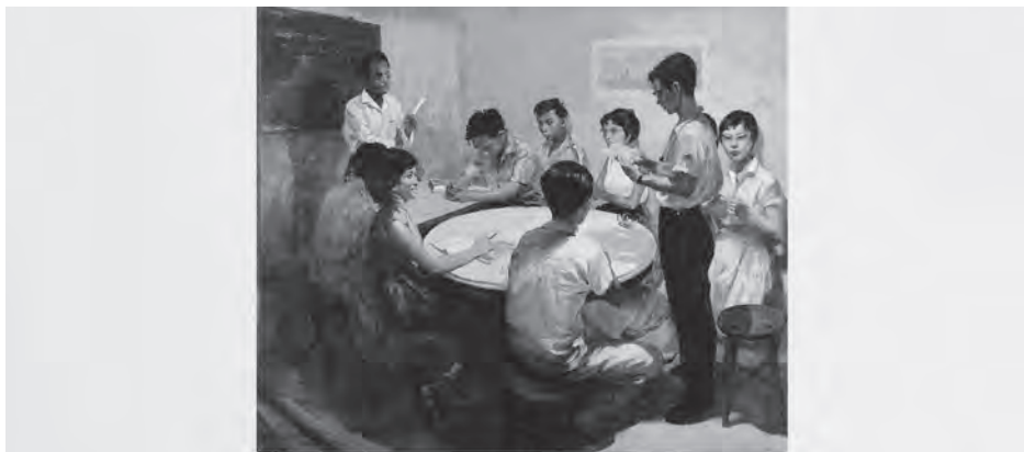
蔡名智《国语教室》1959年 新加坡国立美术馆藏