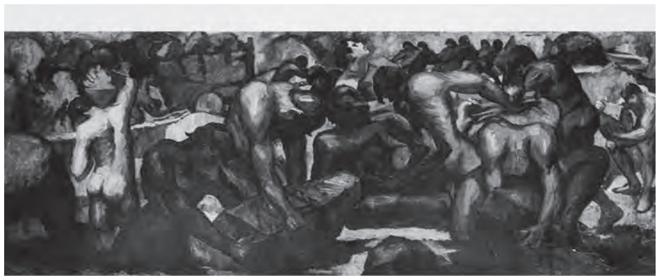
维克托里奥·埃达德斯 (Victorio Edades) 《建设者》(部分) 1928年 菲律宾文化中心藏